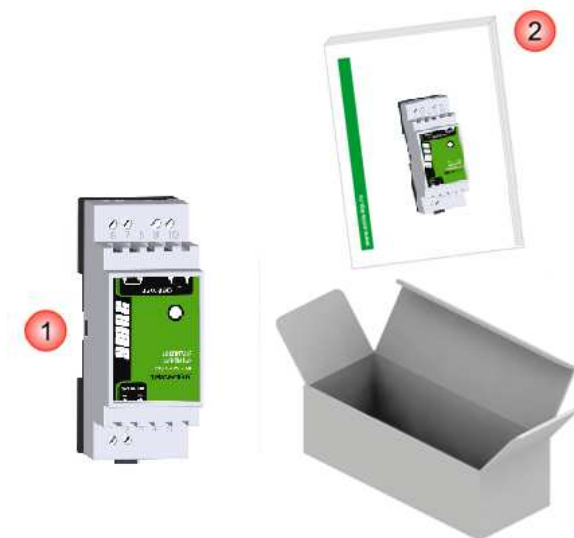
Рисунок 1.1 – Комплект поставки блоков питания

Базовый комплект поставки приведен на рисунке 1.1 и в таблице 1.2.