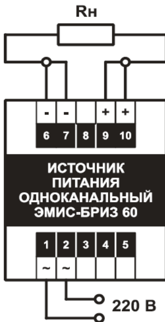
Рисунок 4.1 Схема подключения блока питания ЭМИС-БРИЗ 60 к нагрузке

Схема подключения блока питания ЭМИС-БРИЗ 60 на примере одноканального исполнения приведена на рисунке 4.1. Подключение блоков питания других исполнений производится аналогично.