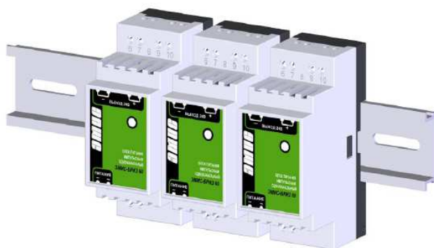
Рисунок 3.2 Установка блоков питания на DIN-рейку